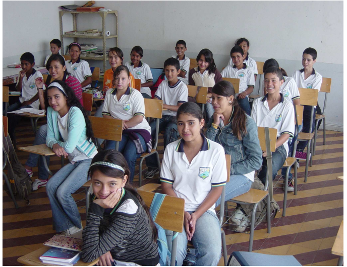
Grupo de estudiantes de la Institución Educativa Nueva Granada, del Corregimiento de Modín, involucrados en el proyecto “Investigón y Preguntina”.

Conscientes de la importancia de la investigación como generador de conocimiento, la dirección de Investigaciones de la Corporación de Estudios Tecnológicos del Norte del Valle, ha dado inicio a la “Escuela de Semilleros de Investigación Investigón y Preguntina ”, como una alternativa para la formación en investigación de los niños, niñas, jóvenes y maestros de las instituciones de básica y media de la ciudad de Cartago.